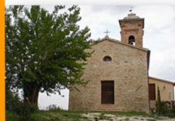
Contrada San Lorenzo